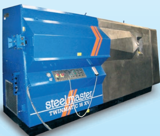
ohýbání betonářské oceli do průměru 16mm na stroji TWINMATIC 16 XV